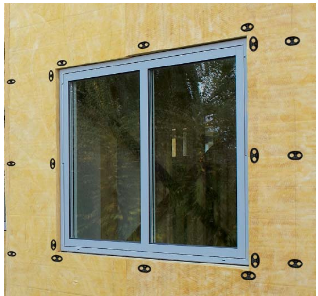
Färdigmonterade ISOVER IsoPigg på ISOVER Easy Fasadskiva 32