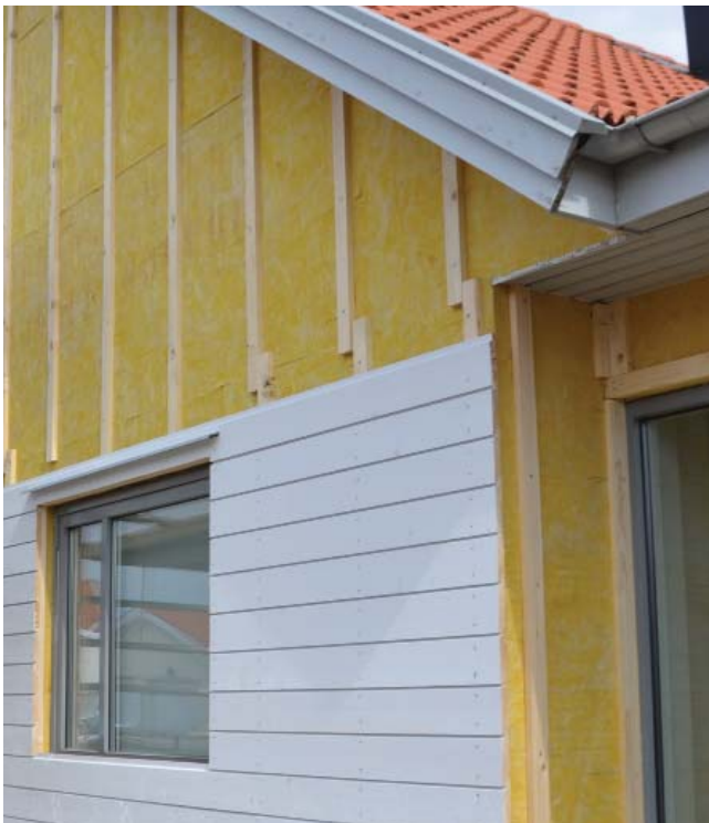
Här syns liggande fasadpanel på spikläkt, placerad på ISOVER Easy Fasadskiva 32.